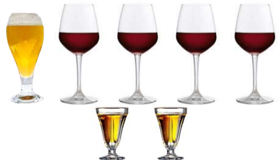
1 BIRRA & 4 BICCHIERI DI VINO & 2 AMARO