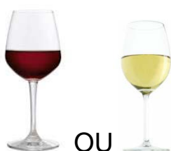
VERRE DE VIN BLANC OU ROUGE (1 dl)