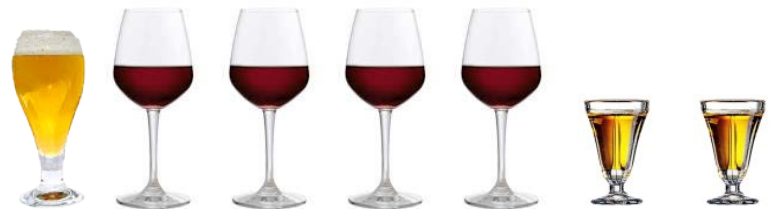
1 BIERE & 4 VERRES DE VIN & 2 DIGESTIF