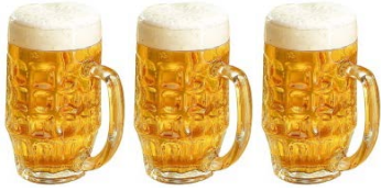
3 CHOPES DE BIERE