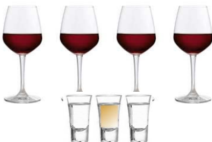
4 VERRES DE VIN & 3 VERRES D'ALCOOL FORT