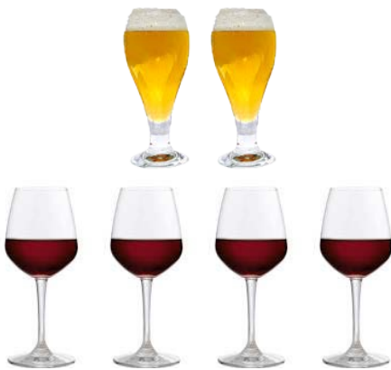
2 BIERES & 4 VERRES DE VIN