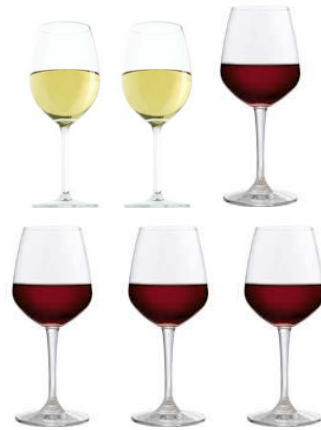
6 VERRES DE VIN