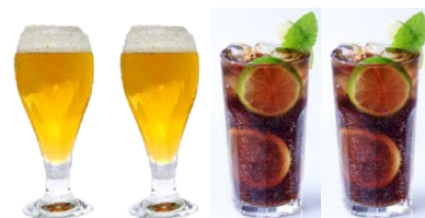
2 BIERES & 2 LONGDRINKS