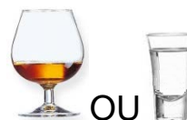
ALCOOL FORT, SHOT (Whisky, Kirsch, Grappa)