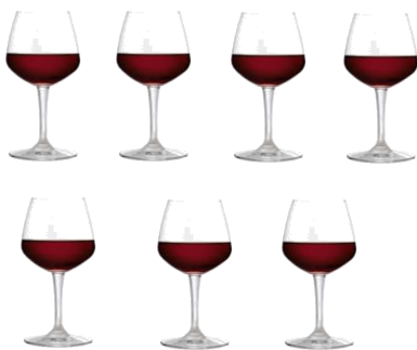
7 GLAZEN WIJN