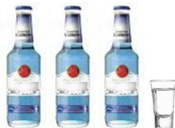
3 FLESJES MIXDRANK & 1 SHOT