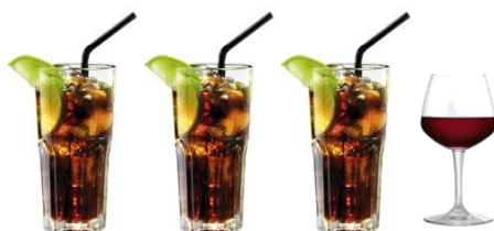
3 MIXDRANKJES & 1 GLAS WIJN