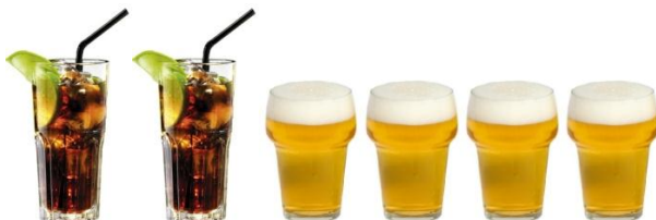
2 MIXDRANKJES & 4 GLAZEN BIER