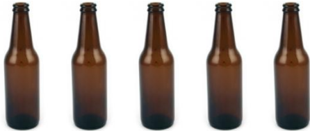
5 FLESJES BIER