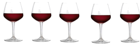
5 GLAZEN WIJN