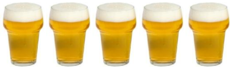
5 GLAZEN BIER