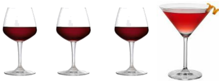
3 GLAZEN WIJN & 1 COCKTAIL