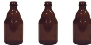
3 FLESJES SPECIALBIER