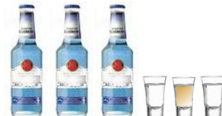
3 FLESJES MIXDRANK & 3 SHOTS